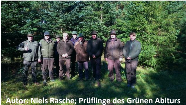
Autor: Niels Rasche; Prüflinge des Grünen Abiturs

Die Jagdausbildung erfordert Wissen über Rechte und Pflichten des Jägers ebenso, wie ein breites Spektrum an Kenntnissen und Fertigkeiten für eine waidgerechte Jagd. Das Privileg Waffen zur Jagdausübung benutzen zu dürfen, erfordert ein hohes Verantwortungsbewusstsein. Diese Grundlage zu lehren ist das Zentrum unserer Arbeit.